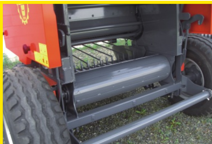
Vista posteriore con allontanatore, rullo, denti infaldatore e catenaria con traversine. Rear view with bale chute, roll, packer device teeth and chain & bars.